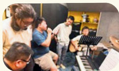
義工與同工協助青年練習

有幸收到邀請，在黃大仙消防局開放日有音樂表演機會，因此邀請在青牧學習樂器的青年參與，其中三位馬上答允，連夜練習後，終於在十月中旬進行樂隊的首次演出。