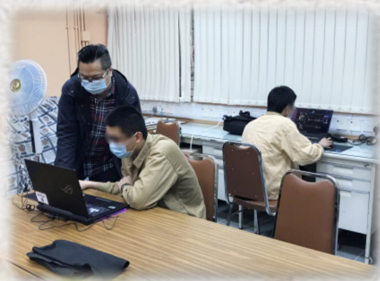
參加者學習拍攝和剪接技巧

站在前線的同工，在環境因素的條件限制下，更需要有堅持的動力和頑強的心志。一月初，我們開展新事工——「創藝牧人行」計劃，是我們共同建立及經歷，亦起動不同牧人領袖，彼此配搭，深化牧養的美好時機。我們一行六人，集前線不同資歷經驗同工，並加上專才導師，彼此集思廣益，設計為期 5 天，以院舍受訓中青年為對象的關顧牧養計劃。計劃目的是針對個人成長及生涯規劃，亦有啟發興趣與展現才藝的元素。