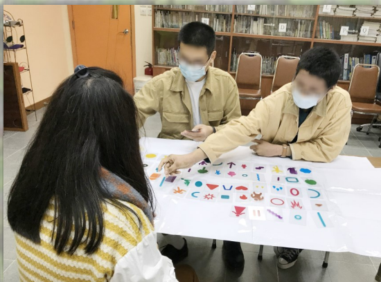
▲ 同工藉圖片為媒介，推動學員學習 陳述事件和表達感受