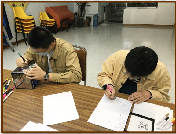
◀ 參加者製作故事盒及製成品 ▶