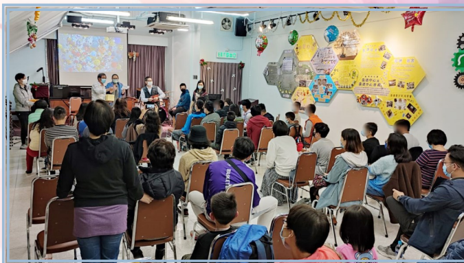
▲ 元旦福音佈道崇拜