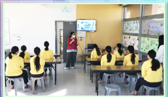
女童收容部感恩節單元活動 ▲