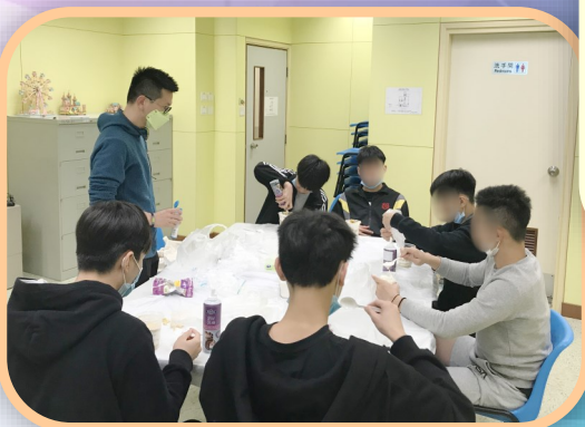
▼ 外展宿舍聖誕福音小組