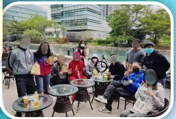
職青團契拆開影響生命的禮物 ▼