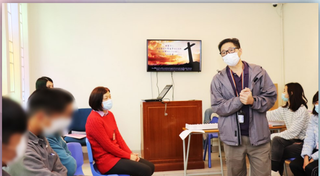
◀ ▲ 懲教院所聖誕節期探訪