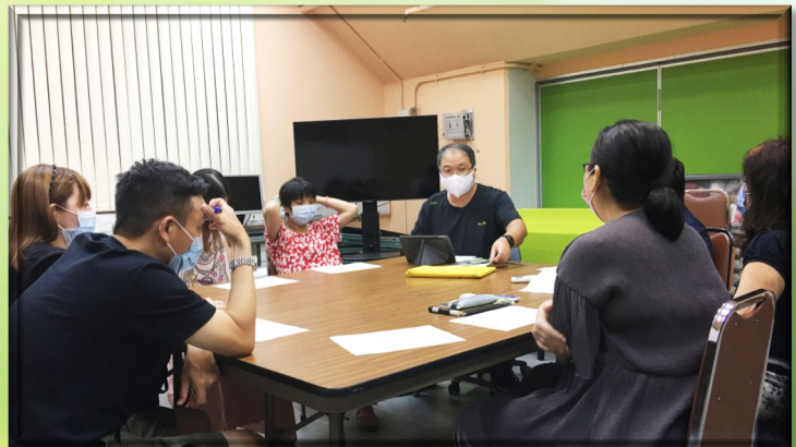
戲裡戲外談領受班 ▼