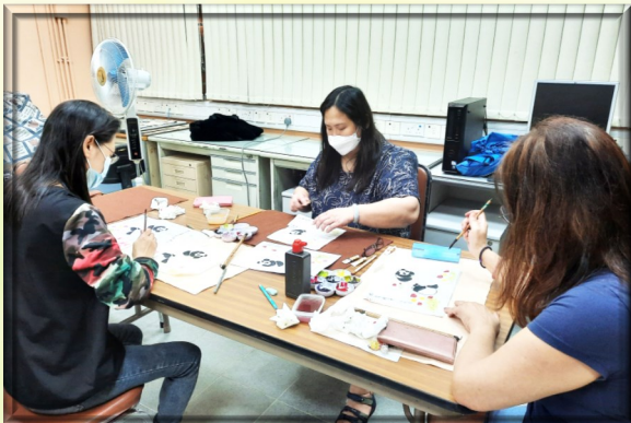
水墨畫班 ▼ ▶

為鼓勵家長在等候及支援子女更生成長期間，堅強也不太孤單地與同樣重視家庭的同路人彼此支持，家心特意定期每月 2 次分別於周四、周五晚及周六下午舉辦多元化的班組活動，包括有「查經班」、「幸福連線班」(禱告+讚美操)、「水墨畫班」、「鉤織班」、「美容美甲活動」及「戲裡戲外談領受班」。希望無論在職或主婦；新舊家長均能透過相聚發展興趣及技能去服務社會弱勢社群，又彼此關懷，為慕道家長日後加入家長團契作預工。