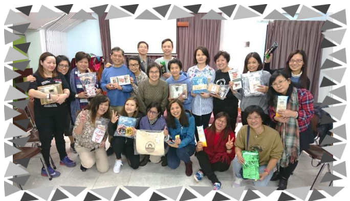
聖誕禮物添氣氛，彼此互勉更開心

聖經詩篇第九章說：「耶和華又要給受欺壓的人作高台，在患難的時候作高台。」我們相信家心的家長團契就是神施恩的信仰支援平台，只要忠心凝聚一班因竭力守護青年子女成長而飽經風暴的家長，引導他們彼此放心傾訴，相憐相惜、勉勵堅守親職，一起學習聖經真理，認識並信靠上帝，他們必定能走出孤苦，在種種困境中經歷神的信實與慈愛！