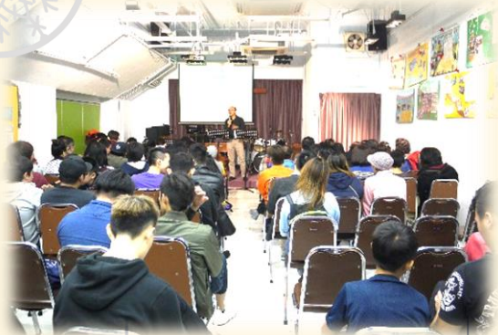
共 77 位受眾出席