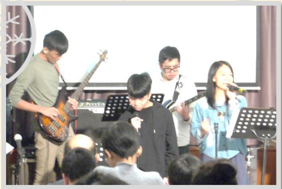
由同工和同學組成的敬拜隊