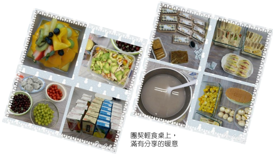
團契輕食桌上， 滿有分享的暖意

2018年12月28日於青牧的家長支援中心（下稱家心），我們開了一個簡單又奇妙的聖誕派對來招待近20位正面對困擾的家長。感恩在同工用心準備及家長們坦誠的交流關懷下，當天派對中簡單的輕食、遊戲、信息、抽獎及彼此代禱分享的環節，上帝施恩成就為一個溫暖人心的聚會！原本孤立的、憂愁的、膽怯的……都因鍥而不捨的邀請下一一來到青牧中心，變成結伴在笑聲、嘆息聲、代禱聲中坦誠共度佳節！