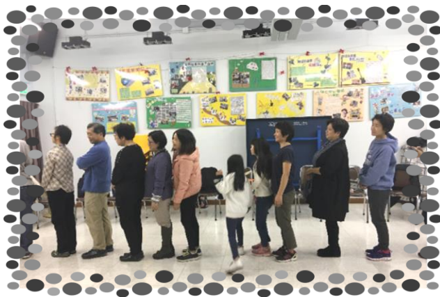
派對上聖經故事遊戲，老少同歡

其實佳節當前，有誰想自己心情總是如打破五味架的酸苦混雜、無一刻安寧？只是不少家心家長在假期比平日更多憂思苦惱：眼看着青年子女問題多多，假日三五成群，肆意狂歡至通宵達旦，自己再三溫柔提醒與勸告起不了絲毫作用，內心不禁又重現昔日子女行差踏錯、甚至干犯法紀而被囚的種種不堪回首的揪心回憶，又怎能若無其事，開懷吃喝歡度呢？