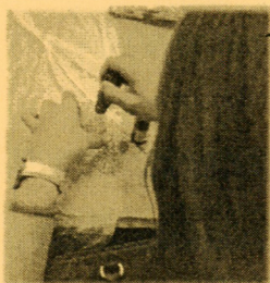
最後一堂製作富有個人風格的香水