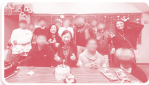
▲ 同場加映生日派對

在「社交」上，相處時的個性碰撞，是一個學習的平台，到來的年輕人，大部分相似的特色是家庭支援較少，不多參與「住家飯」，因此每次在網絡參考的菜色製作及完成後的清洗環節，對部分年輕人來說，是一個新嚐試。而飯後的桌上遊戲，亦令彼此關係更熟悉。