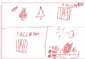
▲ 青年畫出他們在囚中過節的畫面

一封書信，輕如鵝毛卻能穿越冰冷的鐵窗，為在囚青年帶來溫度與盼望。每封信都像一束光，提醒他們仍有人願意關心記念。故此，青牧在 2025 年 12 月中監獄書信義工培訓活動及 2026 年 1 月 10 日壁屋大型活動後，也會隨即跟進寄出義工親手設計的聖誕咭及新年咭（合共 100 多張），盼這種「快速送遞」猶如風揚起的福音種子，有機會落在青年們各種不容易的心田上發芽生長。我們相信恆常書信關懷，更能引發他們思考：非親非故的人為何如此用心相信及支持自己變好？更盼這份關懷能成為信仰的養分，讓心靈在灰暗中重新得力。