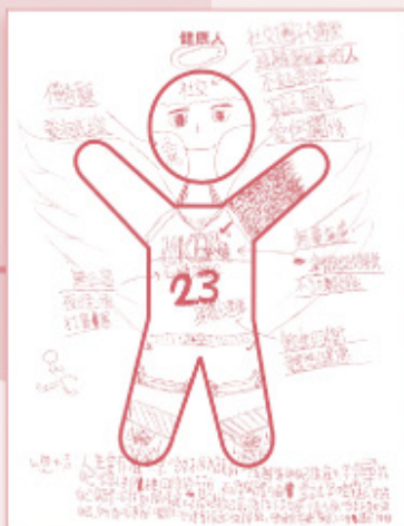
▲ 論盡健康人，位位青年即時變成了全人健康的專家！