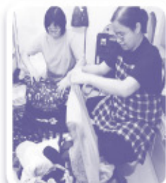
▲ 閨蜜相聚的歡樂時光

當奴當作自修室，進深討論課程上的教導，漸漸明白內心的廢物太沉重，家居才會成為囤積的恐怖家居。現在我明白整理物件，同時也整理思緒，為改善我們母子的關係，真正要捨棄的是我對昔日婚姻的種種怨懟與不捨。感謝神讓青牧提供一個活化身心靈的斷捨離課程，給心裡受傷又乏力的我重新整理身心，再踏上生命新一段旅程。」