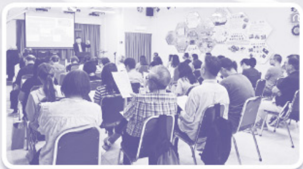
▲ 本屆監獄牧養義工訓練班共有 34 位參加者