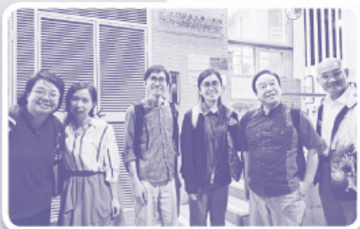
▲ 播道神學院學生自治會證道組隨青牧同工入男童院羈留部探訪及舉辦福音活動