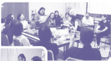
▲ 斷捨離學員心聲分享