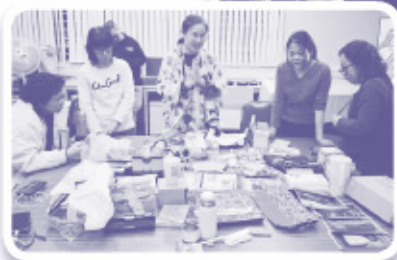
▲ 家長團契之歲晚換物會