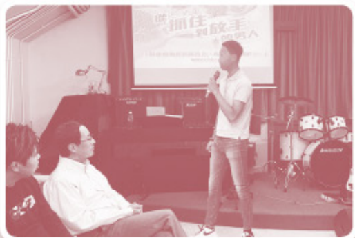
▲ 阿森對牧長和導師們的幫助表達深切感謝