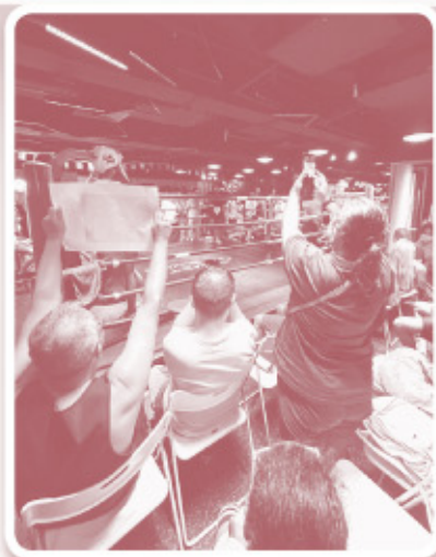
▲ 台下觀眾，熱烈地支持！

會主動給予後母家用。當面對後母時，他會收起「嬉皮笑臉」，認真對答。經歷今次事件後，他感受到家人對他不離棄的重要性，家庭溫暖來自後母和妹妹。