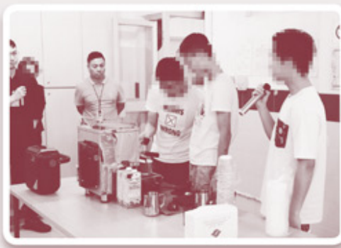
▲ 沖調苦中帶甜的咖啡