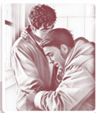
▲ 一個祈禱，一個擁抱，觸動心靈！

後仍然跪係地喊，我睇到，好大感觸。」我說：「我亦好感觸，好得到鼓勵！當我用英文為爸爸祈禱，其實好緊張，好戰兢；祈禱後見到爸爸激動流淚，我都唔知點回應，估唔到青年B即刻攬住佢，我好感動！」說畢，我「肉緊地」拍拍青年B的肩膊，他彷彿從思緒中回來，說：「呢個係我本能反應，我覺得佢啲刻係需要一個Hug，我就咁樣安慰佢。」