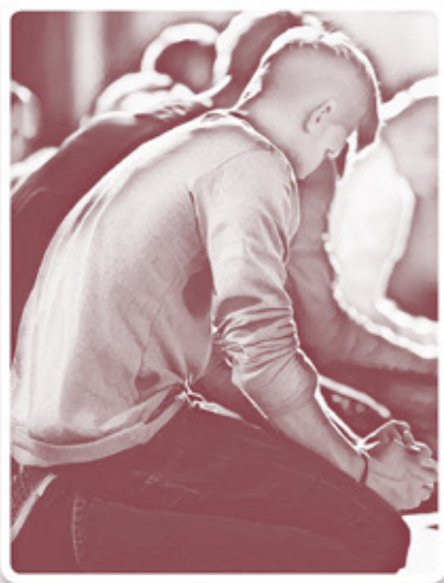
▲ 同心懇切的為事工及羊群的需要祈禱交託天父

我們應該時刻記住決策者是上帝。祂擁有絕對的權力和權威來決定這個世界的運行方式。我們需要祈求謙卑並順服上帝。