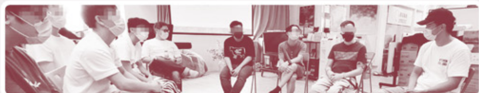
◀ 各小隊交流探訪體會

當中的領袖青年，有的已成信徒，扎根信仰，有的仍尋求認識中，等待與神相遇的經歷。我們切切禱告天父恩光普照心靈，引導青年由起初「憑良心反應行善」到「倚靠天父所量給各人的恩賜行善」，能在行動關懷別人的服事上，也能經歷禱告得恩助的安慰，與主同工。阿們。