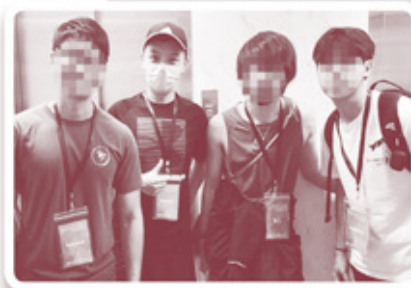
▲ 探訪小隊如精兵，體魄強健並有溫柔心靈

有一次，當我們行程緊湊，正趕赴下一個家庭送生活物資。我們同行三人，剛離開探訪的大廈，我心中正沉澱剛才震撼的一幕，青年A彷彿有同感說：「探訪嗰位爸爸，佢祈禱