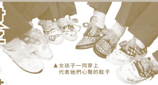
▲女孩子一同穿上代表她們心聲的鞋子