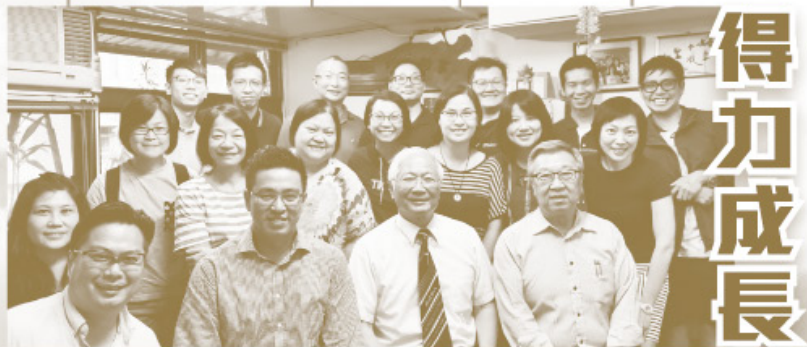
▲同工與更生團契牧者合照