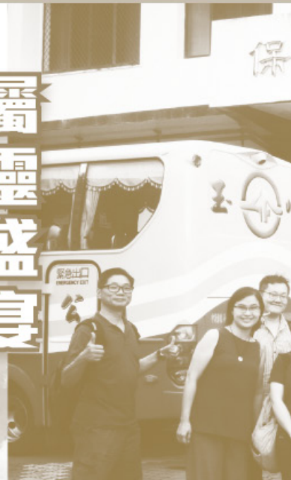
▲苗栗戒毒村內合照