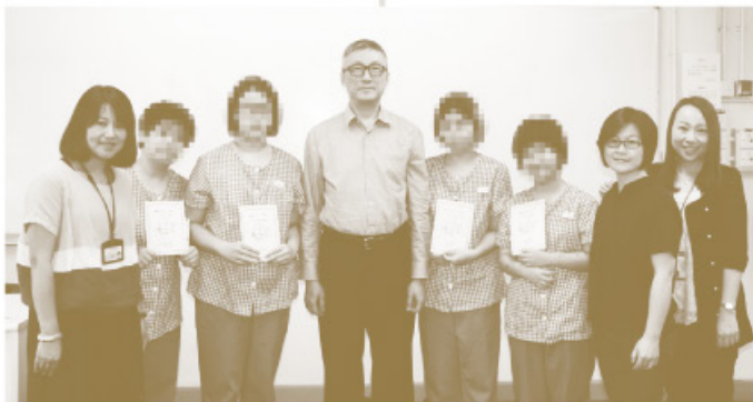
▲監督、組員與同工合照

這計劃的三大元素：女子、鞋子、成長故事，在典禮的這一瞬間，呈現在我們青牧同工和院所長官的眼前。首屆在女性院所開展的「好鞋子」已在本年5月底告一段落。如今參與之青年仍在院內受訓，我們同工持續以個人面談，心靈關顧及信仰介入。隊工亦將在不同類別的女性院所陸續開展「好鞋子計劃」，盼能累積牧養女性在囚青年的經驗，調配出更適切她們、回應成長需要及餵養心靈的牧養工具。