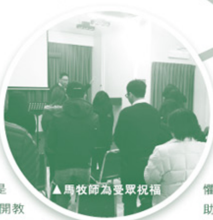
▲馬牧師為受眾祝福