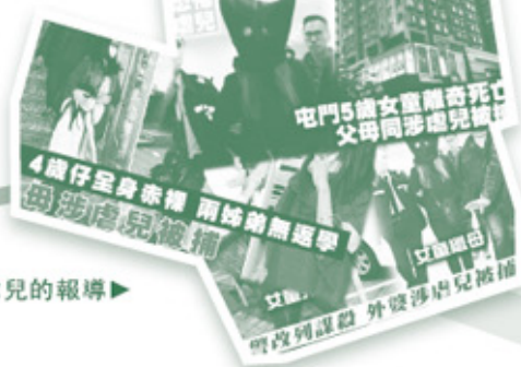
近期有關虐兒的報導▶