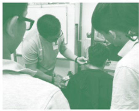
▲學員專注地觀看導師的示範