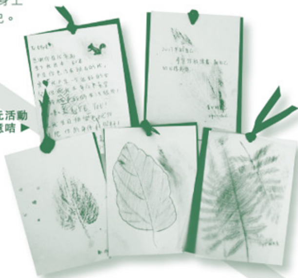
女童於單元活動 制作的心意咭▶

「……將萬有服在祂的腳下，使祂為教會作萬有之首，教 會是祂的身體，是那充滿萬有者所充滿的。」（弗一：22-23）