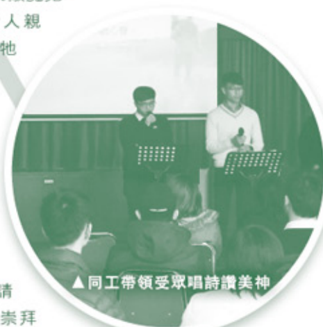
▲同工帶領受眾唱詩讚美神