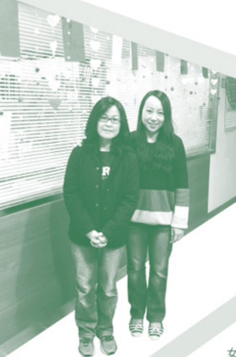
◀ 屯門院女童部隊工