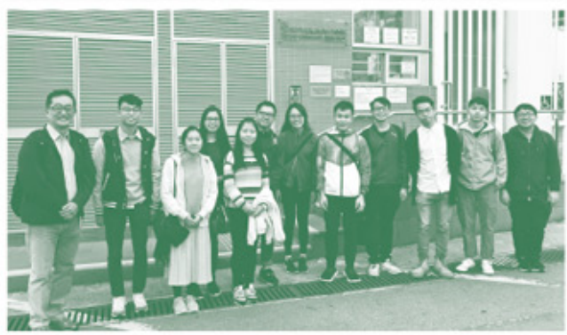
◀青牧同工與宣道會屯門堂義工攝於屯門院門前