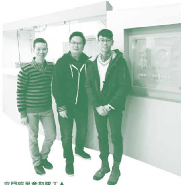
屯門院男童部隊工▲

「過去曾與兩位院童傾談,發覺他們非常友善和健談……問及他們離院後有甚麼目標,兩人直接表示『唔知呀……』,