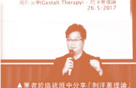
▲筆者於造就班中分享「剝洋葱理論」