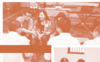
▲▶ 壁屋懲教所內與所員分組面談中