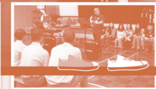
▲小組成員於壁屋懲教所內分享