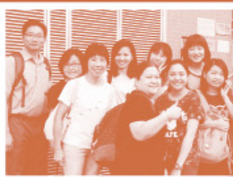
▲▶ 同工與感化院男/女童部組員於感化院外合照