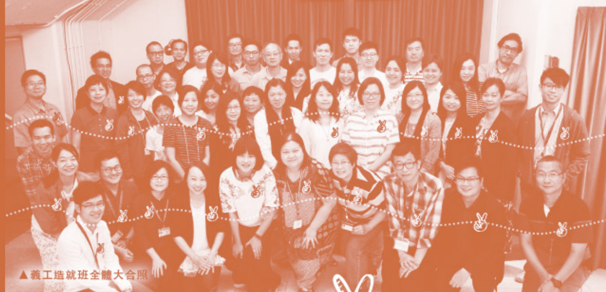
▲義工造就班全體大合照