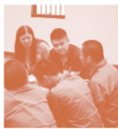
本屆義工造就班學員