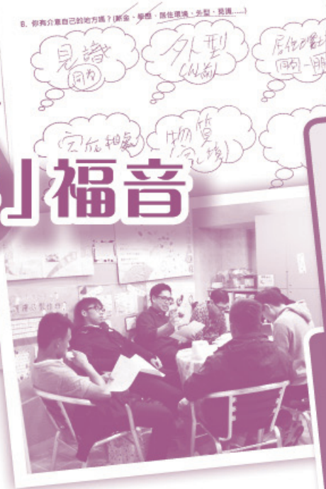
▲一班學員正在輪流讀聖經