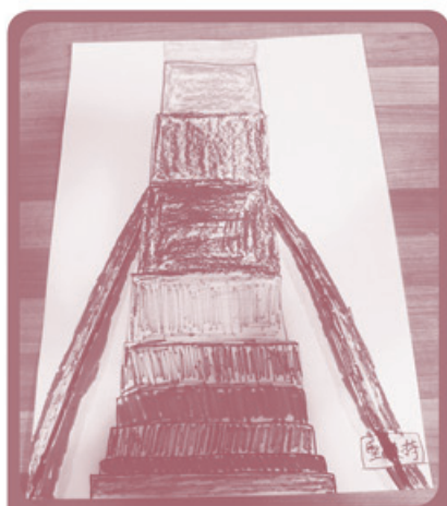
這位家長表達自己親職路上的堅持。