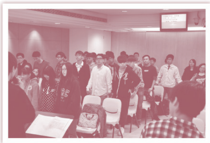
▲青牧樂器班學員參加教會佈道會