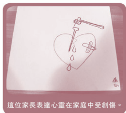
這位家長表達心靈在家庭中受創傷。

梳理自己的心靈櫃桶，對自己有不少新發現呢！大家分別表達說：「我發現原來橙色會令我很開心。」「喜樂令我想到太陽。」「半圓的線條有集中歡樂的意思。」「柴，代表憤怒是有源頭的。」「放射性的線條代表我的憤怒會延伸。」「我起初想不到怎畫，但畫下畫下竟又畫了出來。」