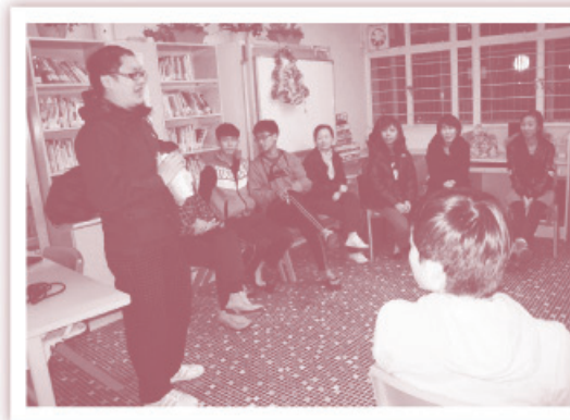
▲在長康宿舍為功輔班的同學舉辦聖誕晚會。

功輔班的同學舉辦了一個聖誕晚會。針對他們 一般對聖經內容是道聽塗說、對福音也是半信半 疑的情況，隊工希望幫助他們整理雜亂的信仰理 解，不要以為福音只是歷史事件，也是身邊人的 信念和生活核心。晚會設計成三部分，第一部分是 聖誕之謎，讓同學各自講述自己理解的聖誕節 來源版本，拼湊出來的故事卻是互相矛盾及笑料 百出。第二部分是聖經之迷，各人猜題：聖誕老 人怎能在一晚裡將所有的禮物送到全球的兒童手 裡，然後對照聖經裡耶穌的誕生及他出生時所收 到的禮物，還原聖誕禮物的本來意義。第三部分 是同工的見證，活生生的將自己與神的關係怎樣 建立與同學分享。