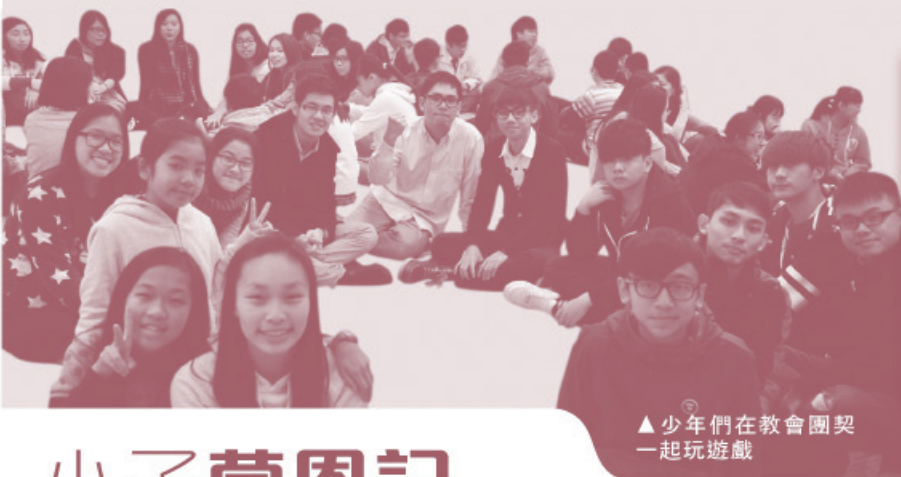
▲少年們在教會團契一起玩遊戲

這班高小學生很快便會升中學，進入另一個成長期，面對更多的挑戰，我們盼望能與教會一同牧養他們，幫助他們因早早認識那位道成肉身的主耶穌而擁有豐盛的人生。