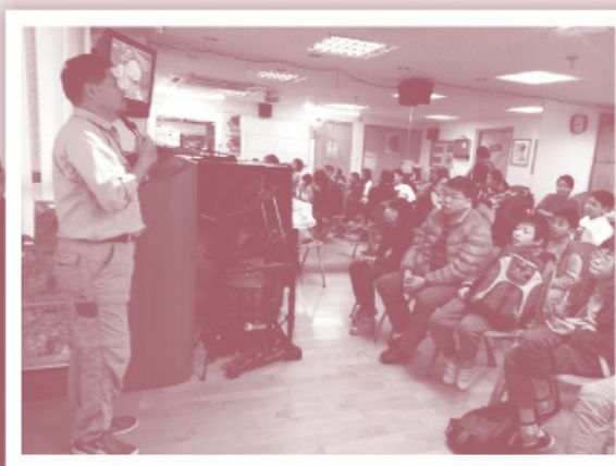
▲小學生們在聖誕活動中留心聽佳音