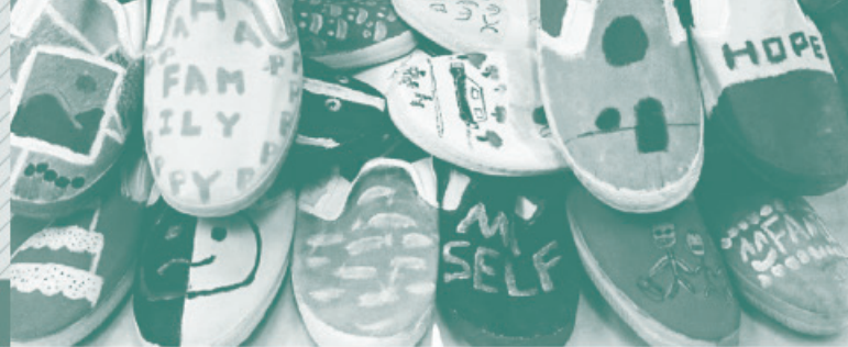
▲斑斕色彩的作品述說成長故事

能洗滌心靈、重燃內心良善？又或是上帝藉組內的互動、同工的回應、彼此的分享，在當中光照他們認真和坦白面對自己過去和將來的事？