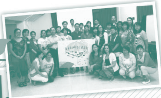
▲簡單而隆重的家長教育課程開學禮