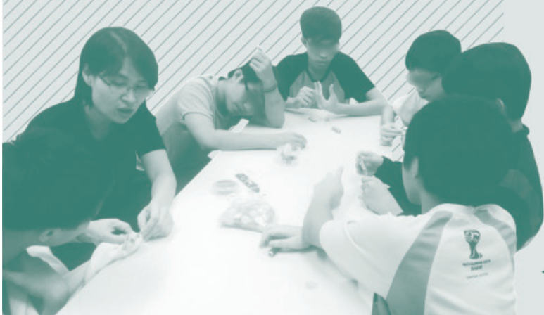
◀ 同工帶領巧手藝小組

深願主內兄弟們持續為新工場代求，願神帶領我們與宿生建立真誠互信之同行關係，領他們到主裡蒙福成長。